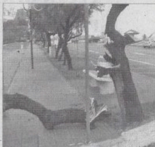
Un albero sradicato

Decine gli interventi degli operai comunali registrati