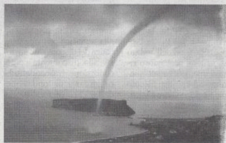
La tromba d'aria e sullo sfondo l'isola di Dino

L'evento atmosferico visibile sull'isola di Dino