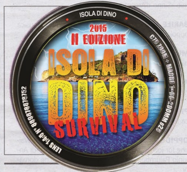
I partecipanti dell'edizione scorsa, il logo e la costa di Maratea